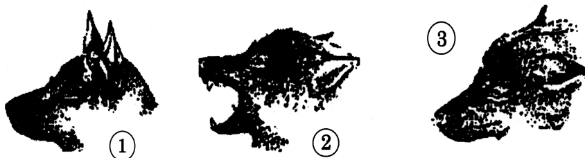
Abbildung Abbildung Abbildung